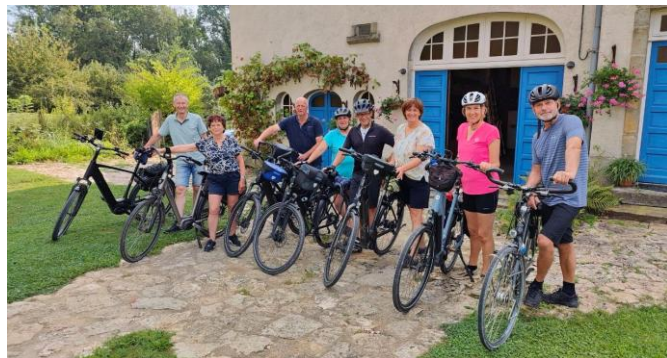
Mooie herinneringen aan de vele groepsarrangementen