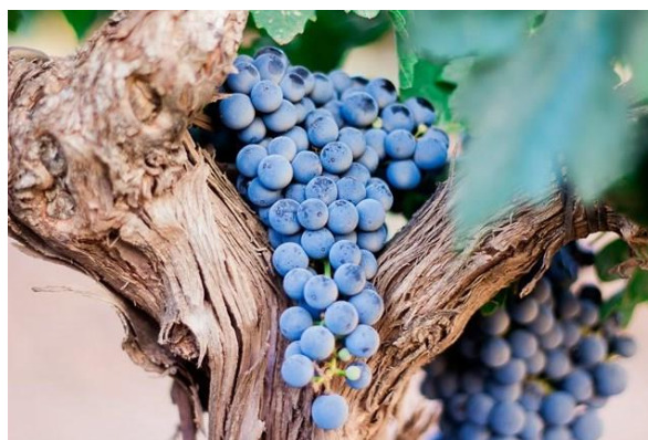
Pinot noir druiven hebben een blauwe schil en wit sap.

Van hun huis staat zowel een rode als een witte wijn op onze kaart.