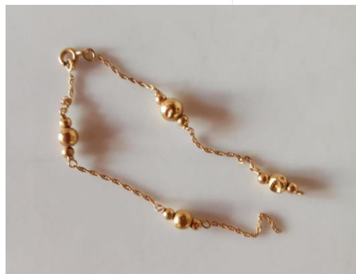
Ben jij dit gouden armbandje kwijt? Bel ons dan even.

Afgelopen week vonden we een gouden armbandje buiten tussen de kiezel. Maar we weten niet van wie dat zou kunnen zijn? Mocht jij het kwijt zijn, bel ons dan even. Dan sturen we het graag voor je op.