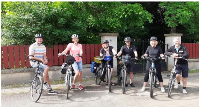
Met z'n zessen op de fiets.

De Côte des Bar leent zich uitstekend om heerlijk te fietsen. Het is een heuvelachtig parcours met hoogte verschillen tussen de 200 en 450 meter. Een mooie uitdaging voor de geoefende fietser. En heb je een fiets met trapondersteuning dan gaat het 'bijna' vanzelf.