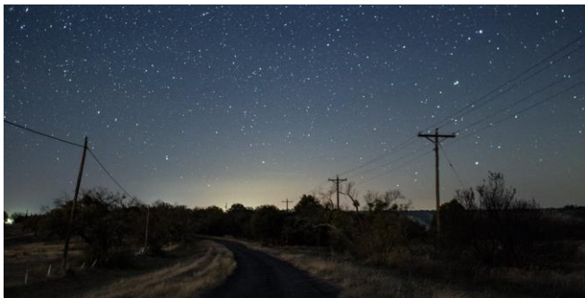
Sterren zover als je kunt kijken.

is nog mooier dan hij al was. Om energie te besparen heeft de gemeente Cunfin besloten om tussen 23.00 en 5.00 uur de straatverlichting uit te doen. Er is bij ons geen lichtvervuiling. Als de maan niet al te veel haar best doet, is het is aardedonker. En dat levert natuurlijk een prachtige sterrenhemel op.